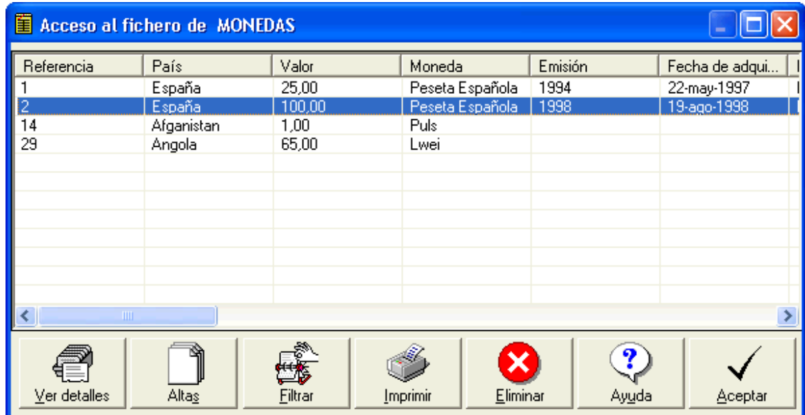
Captura de la ventana de acceso a los datos.

A continuación se muestran algunas capturas de las ventanas más significativas de Monesoft: